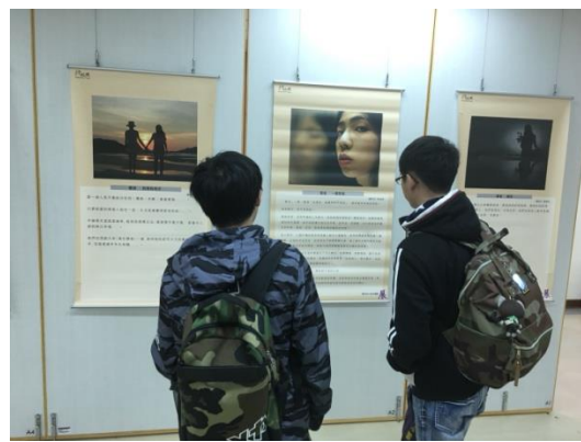
7. 同學觀賞攝影作品